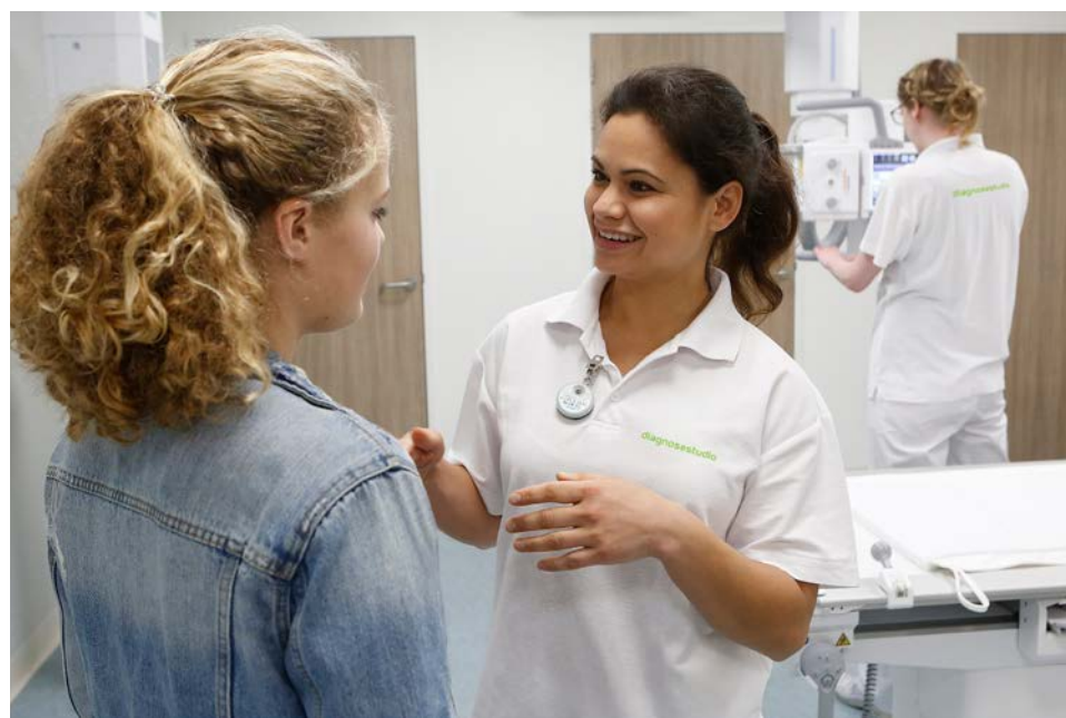
• In de Diagnosestudio kunnen patiënten onder meer terecht voor eenvoudig beeldvormend onderzoek.

kunnen bijvoorbeeld huisartsen, tandartsen, fysiotherapeuten en verloskundigen onder één dak werken, samen met een Diagnosestudio en poliklinische zorg van Tergooi. In de Diagnosestudio kunnen patiënten terecht voor eenvoudig röntgenonderzoek, botontkalkingsonderzoek en echografie. Er komt ook een bloedafnamepost en een inname-loket voor urinemonsters en dergelijke.